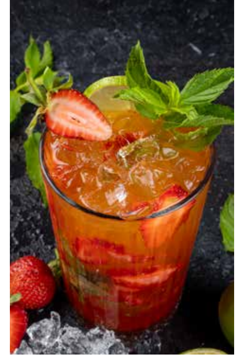
210,00₺ Summer refresher