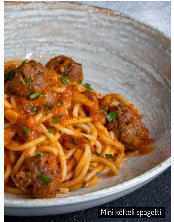
Mini köfteli spagetti