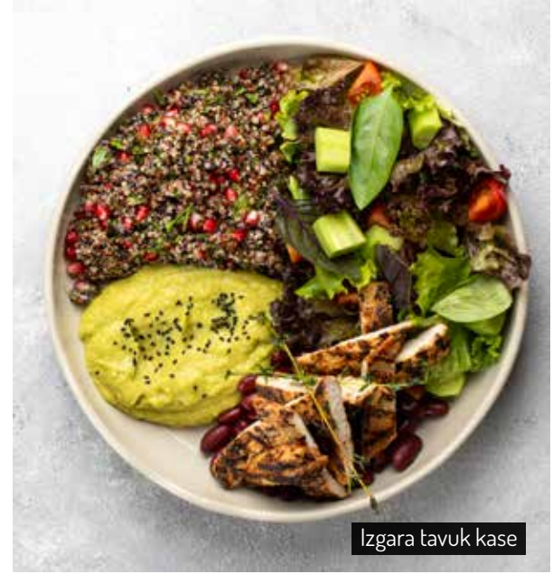
Izgara tavuk kase