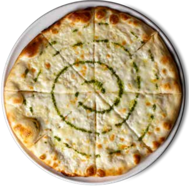
445,00₺ 5 Peynirli 5 Cheeses

Labne peynir, Ezine peynir, tulum peynir, mozerella peynir, parmesan peynir ve pesto sos Labneh cheese, Ezine cheese, tulum cheese, mozzarella cheese, parmesan cheese and pesto sauce