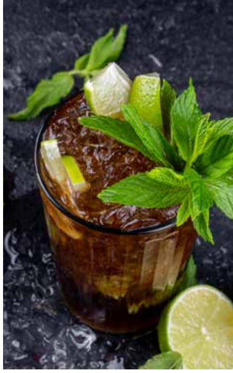
210,00₺ Coke mojito