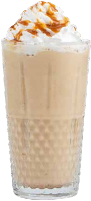
195,00₺ Karamel chai tea latte Caramel chai tea latte