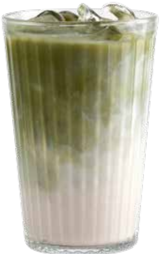
150,00₺ Ice Matcha latte

Matcha ürünlerinde bitkisel süt kullanılmaktadır. Matcha products use vegetable milk.