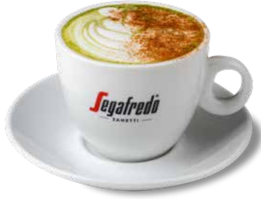
Yeni 150,00₺ Honey cinnamon matcha Matcha, bal, tarçın, badem sütü