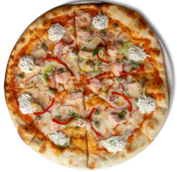
455,00₺ Somon Salmon

Labne peynir, Ezine peynir, tulum peynir, mozerella peynir, parmesan peynir ve pesto sos Labneh cheese, Ezine cheese, tulum cheese, mozzarella cheese, parmesan cheese and pesto sauce