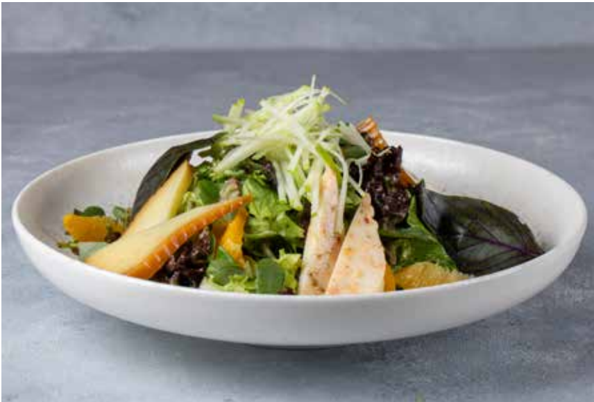
325,00₺ Kış meyveli salata Winter fruit salad

Mısır, havuç, çeri domates, salatalık, el yapımı erişte, mevsim yeşillikleri ve İtalyan salata sosu Corn, carrots, cherry tomatoes, cucumber, handmade noodles, seasonal greens and Italian salad vinaigrette