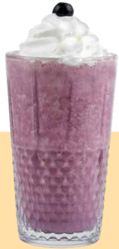
180,00₺ Yaban mersinli milkshake Blueberry milkshake