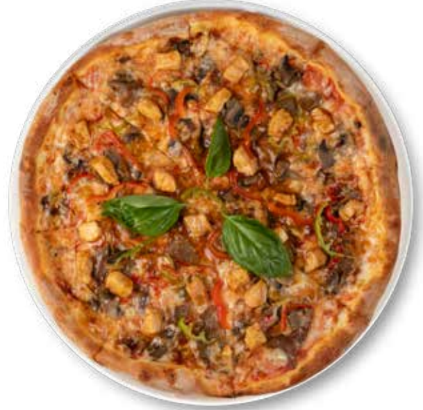
395,00₺ Barbek  Tavuk BBQ Chicken

İtalyan pizza sos, mozerella peynir, kestane mantar, kültür mantar, ıspanak, karamelize soğan ve t r fl  mayonez Italian pizza sauce, mozzarella cheese, chestnut mushrooms, cultivated mushrooms, spinach, caramelized onions and turbuffle mayonnaise