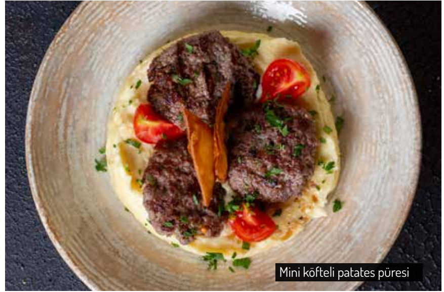
Mini köfteli patates püresi