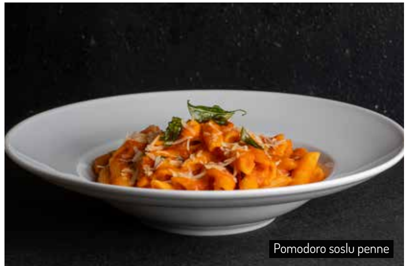
Pomodoro soslu penne

Makarnalarımız taze ve günlük olarak hazırlanmaktadır. Our pastas are fresh and prepared daily.