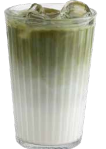
180,00₺ Matcha coconut