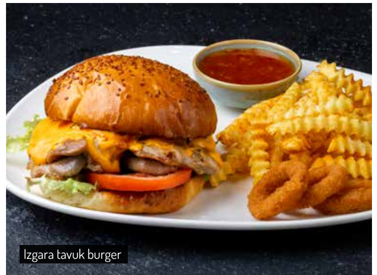
Izgara tavuk burger