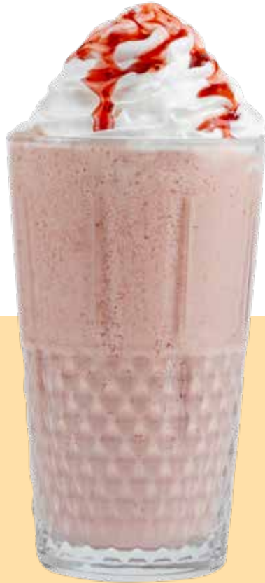
180,00₺ Çilekli milkshake Strawberry milkshake