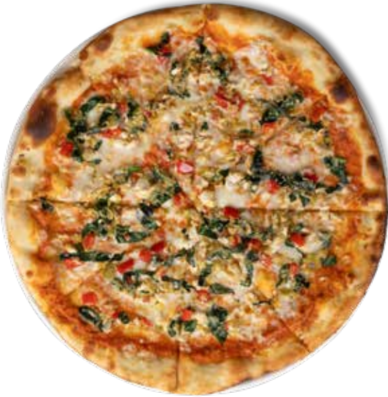
345,00₺ Sebzeli otlu vegetables and herbs

İtalyan pizza sos, mozerella peynir, renkli biberler, mor soğan, kapari, somon, dereotu ve labne peynir Italian pizza sauce, mozzarella cheese, colored peppers, purple onion, capers, salmon, dill and labne cheese