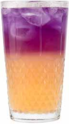
180,00₺ Blue butterfly