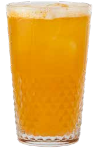
180,00₺ Ananas passion