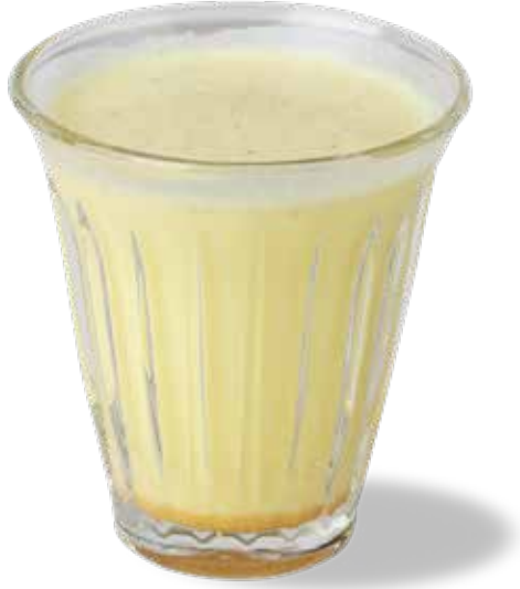
Yeni 150,00₺ Golden Milk Süt, zerdeçal, zencefil, bal, muskat