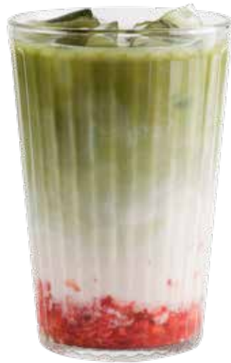
180,00₺ Matcha strawberry