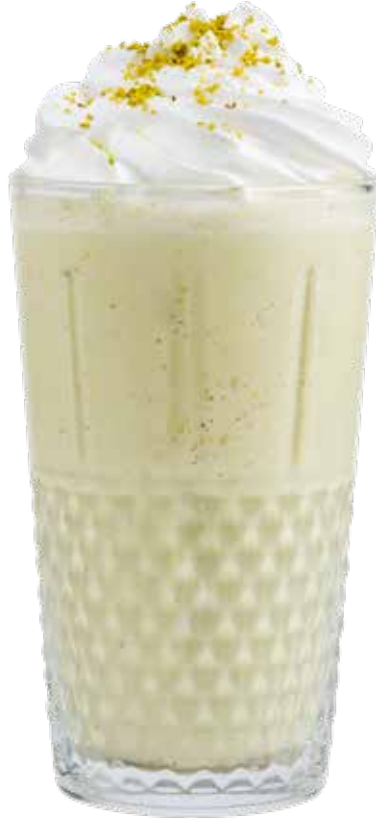
210,00₺ Antep fıstıklı latte Pistachio latte