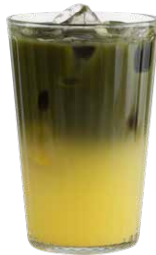
180,00₺ Matcha lemonade