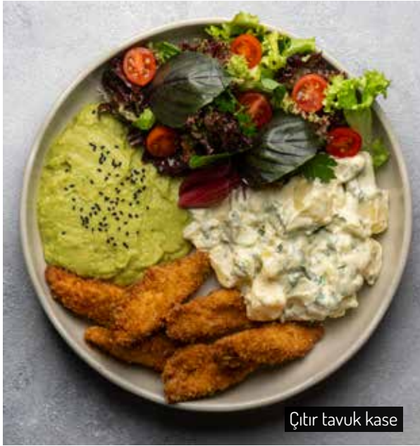
Çıtır tavuk kase