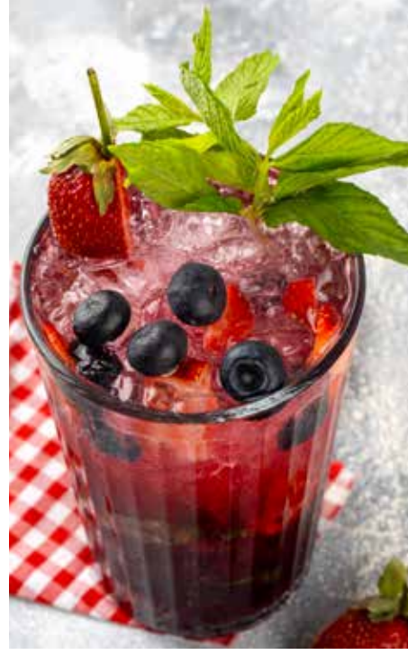
210,00₺ Blueberry refresha