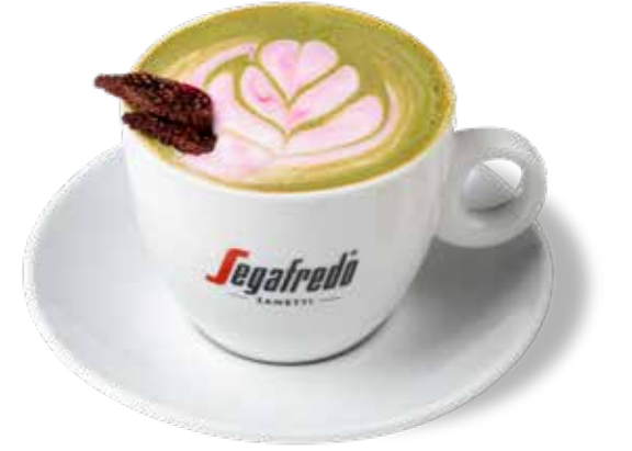
Yeni 160,00₺ Strawberry cream matcha Matcha, çilek, badem sütü