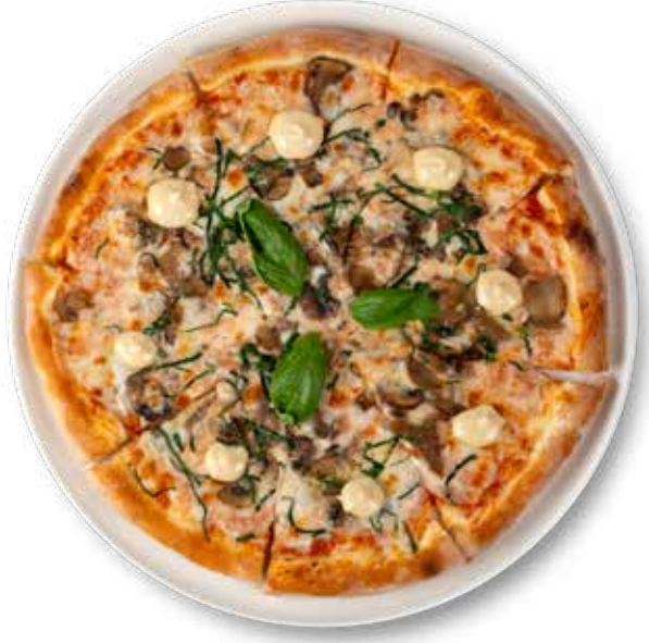
375,00₺ Mantarlı pizza Pizza Funghi

Pizza servisimiz saat 12:00 'de başlamaktadır. Pizza service starts at 12:00 pm