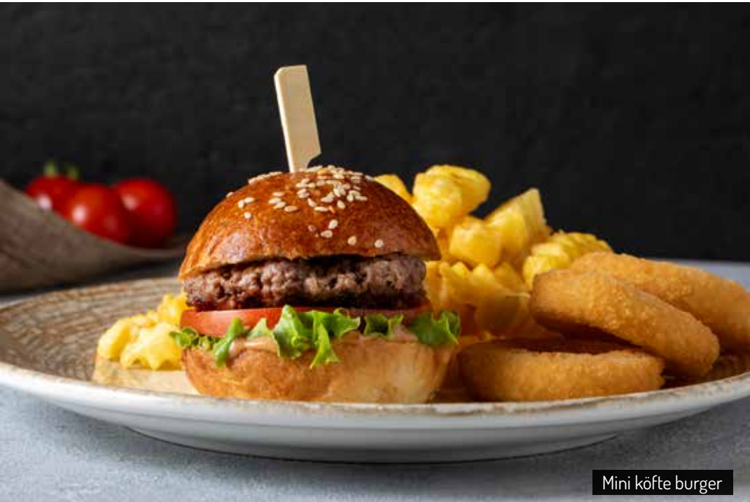
Mini köfte burger