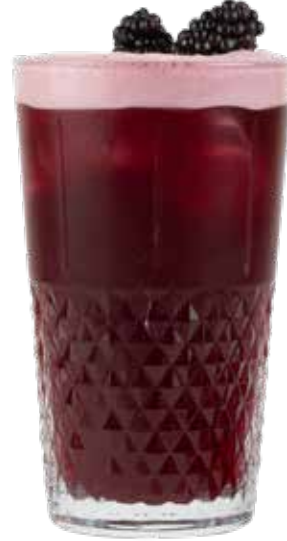
180,00₺ Berry lemonade