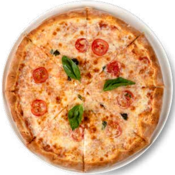
310,00₺ Pomodoro Margeritha Pomodoro Margeritha

İtalyan pizza sos, mozerella peynir, barbek  soslu tavuk par aları, renkli biberler, Jalepeno tur u, mantar ve kırmızı soğan Italian pizza sauce, mozzarella cheese, chicken pieces with barbecue sauce, colorful peppers, pickled jalepeno, mushrooms and red onions