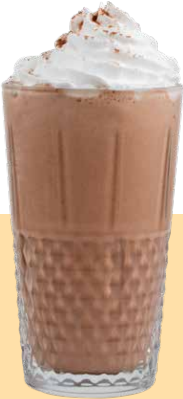
180,00₺ Çikolatalı milkshake Chocolate milkshake