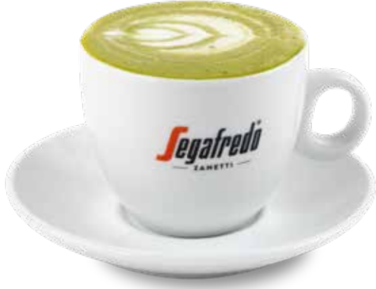
140,00₺ Matcha latte