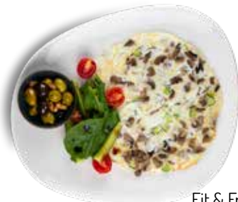
Fit & Fresh