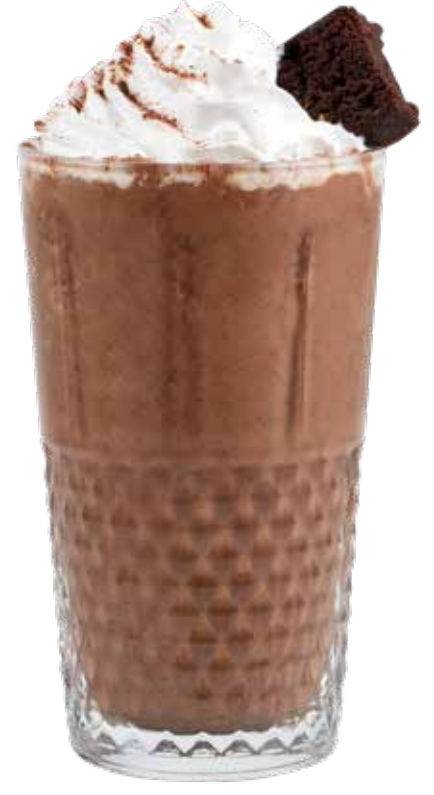
195,00₺ İrlanda Brownisi Irish Brownie