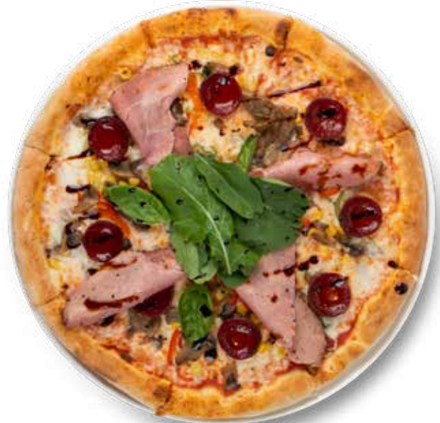
475,00₺ Jules Special Jules Special

İtalyan pizza sos, mozerella peynir,  eri domates ve pesto sos Italian pizza sauce, mozzarella cheese, cherry tomatoes and pesto sauce