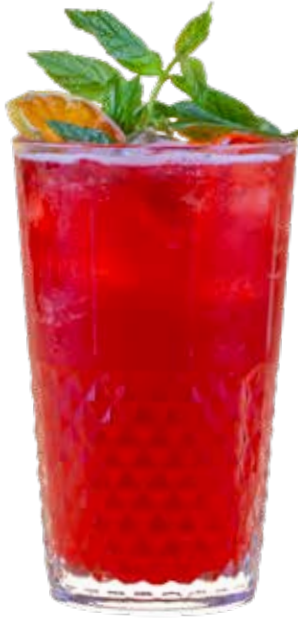
180,00₺ Hibiscus Mint